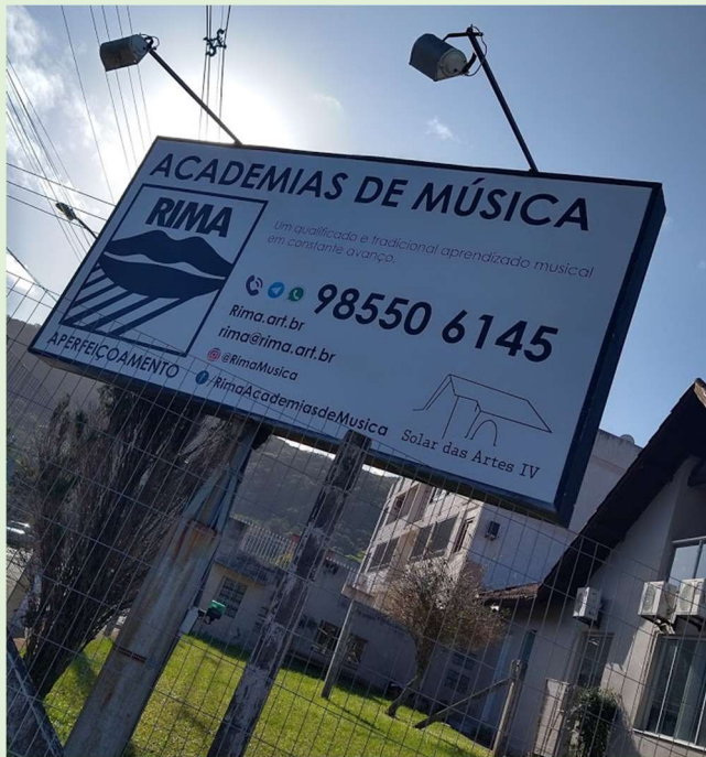
Julho de 2020.