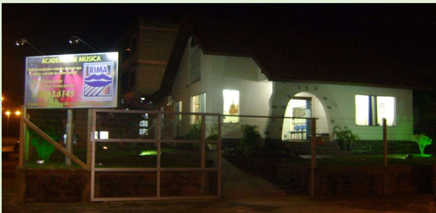
Junho de 2011.