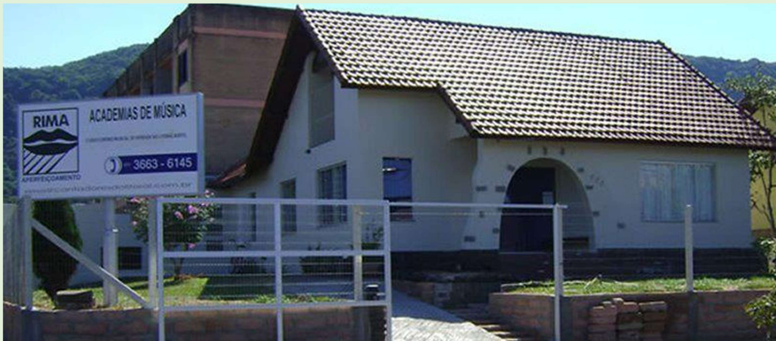
Junho de 2009.