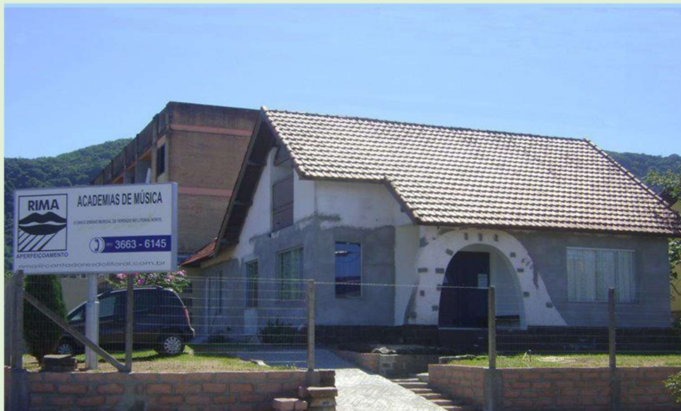
Foto de abril de 2009, em meio a primeira reforma.