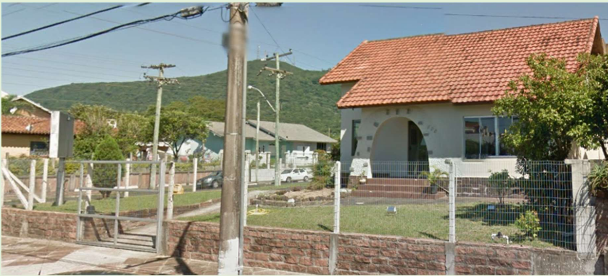
Junho de 2015.