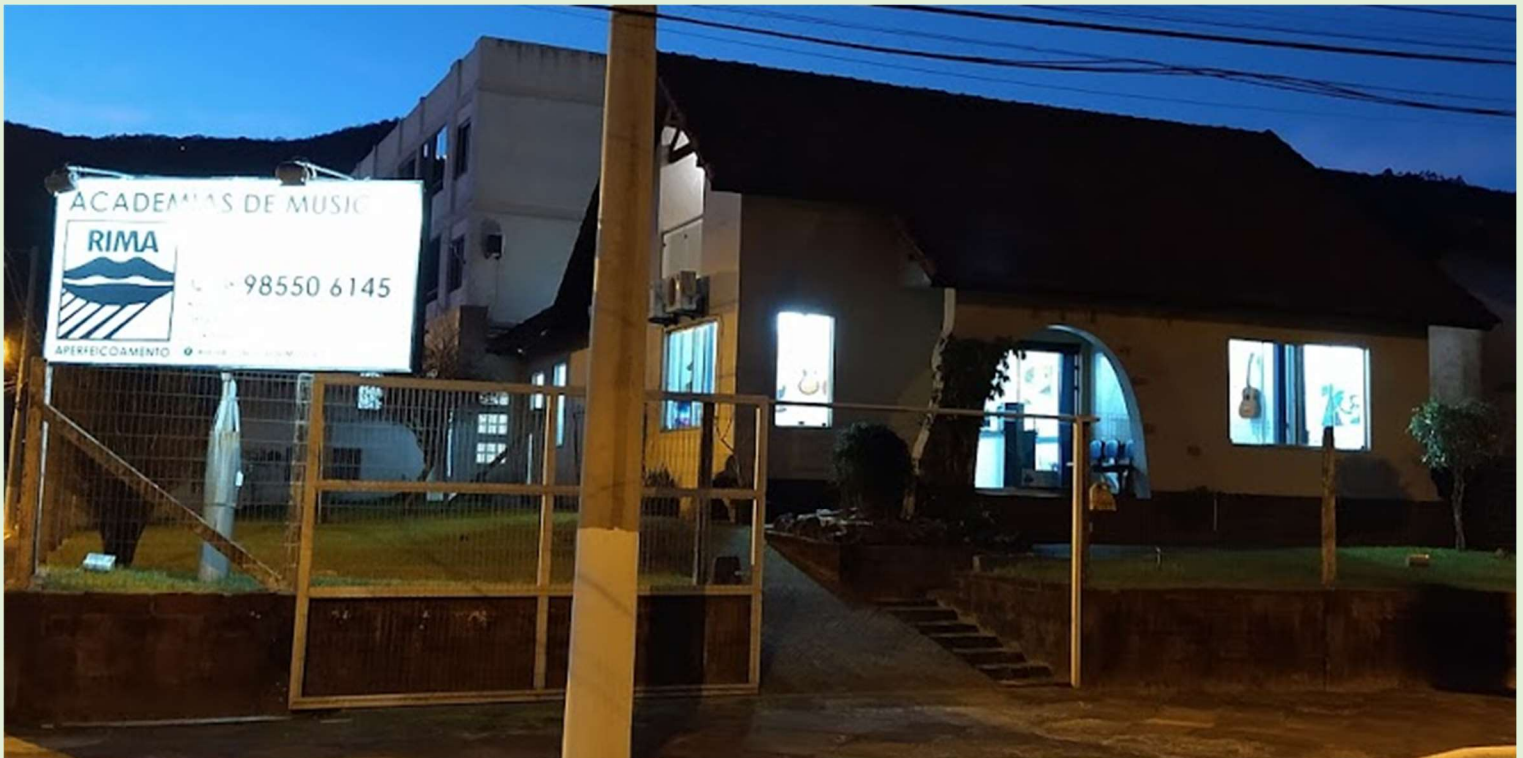
Julho de 2020.