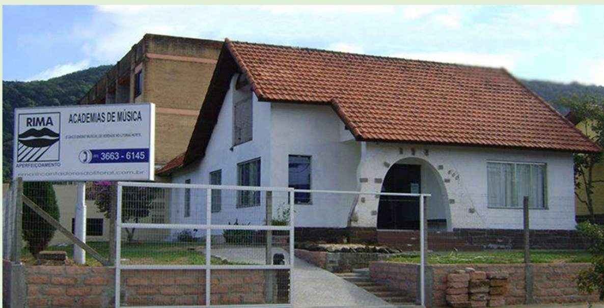
Maio de 2009.